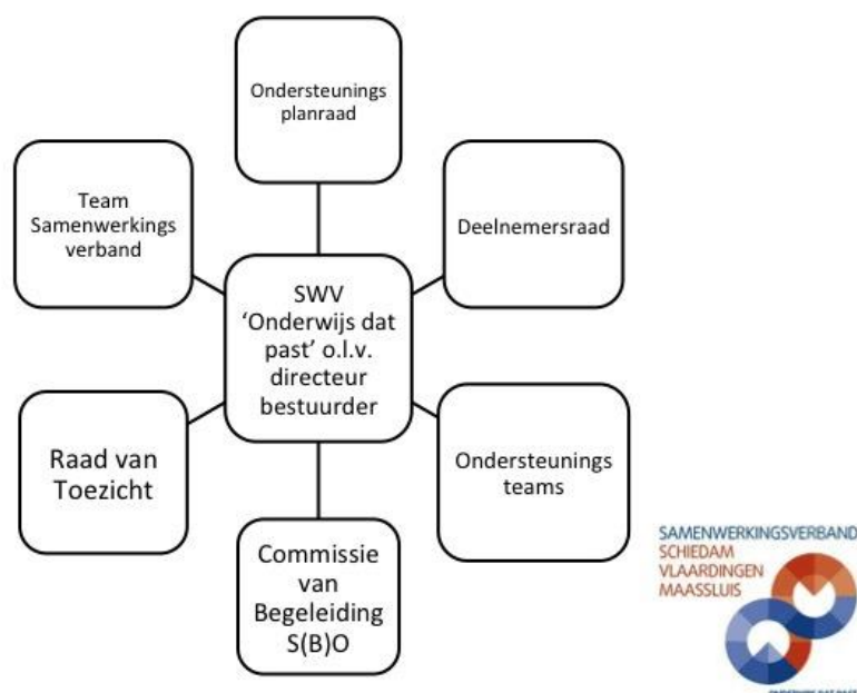
Relatieschema Samenwerkingsverband Schiedam, Vlaardingen, Maassluis Onderwijs dat past

De organisatie van het samenwerkingsverband laat zich het beste visualiseren in een relatieschema, met de meest directe relaties daarin opgenomen. Externe partijen zoals gemeenten en jeugdhulppartners zijn voor de overzichtelijkheid niet opgenomen in dit schema.